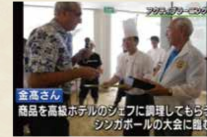
シャングリラホテルGMによる表彰式 シンガポール、シャングリラホテルとの共同開催による世界大会。各国シェフが宝物素材での新メニューを開発。その模様をNHKがニュース放映。