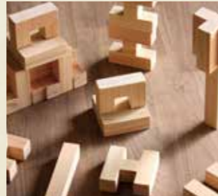
ダイワ産業株式会社