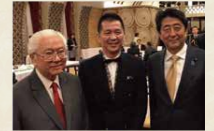
安倍首相(当時)主催のSG大統領晩餐会に招待 「にっぽんの宝物」の取り組みが認められ、安倍首相(当時)主催のトニータン シンガポール大統領(当時)への晩餐会に招待される。