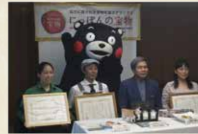
熊本県知事によるお祝い会&壮行会 熊本県知事による「日本の宝物ジャパンGP」での受賞者へのお祝い会。並びに同世界大会への壮行会。この模様はテレビにも中継された。