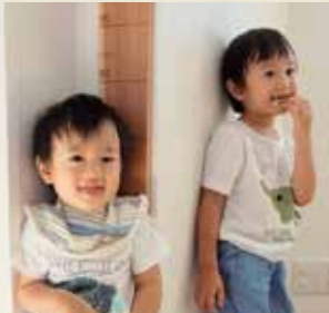
森庄銘木産業株式会社 社会福祉法人青葉仁会

すくすく育つ!奈良の林業家が 作った子育て記録の「身長計」 ~木育での想いを、子育てに乗せて~